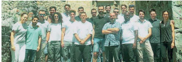
La carica dei 24 Gli studenti che hanno completato il biennio di formazione.

Due anni di studio nel segno dell'innovazione. In questi giorni si è concluso con successo il primo corso biennale ITS Maker per tecnici superiori. Ventiquattro stu-